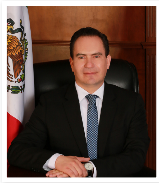
DIP. JUAN CARLOS MATURINO MANZANERA COORDINADOR DE LA BANCADA DEL PARTIDO ACCIÓN NACIONAL DE LA LXVIII LEGISLATURA